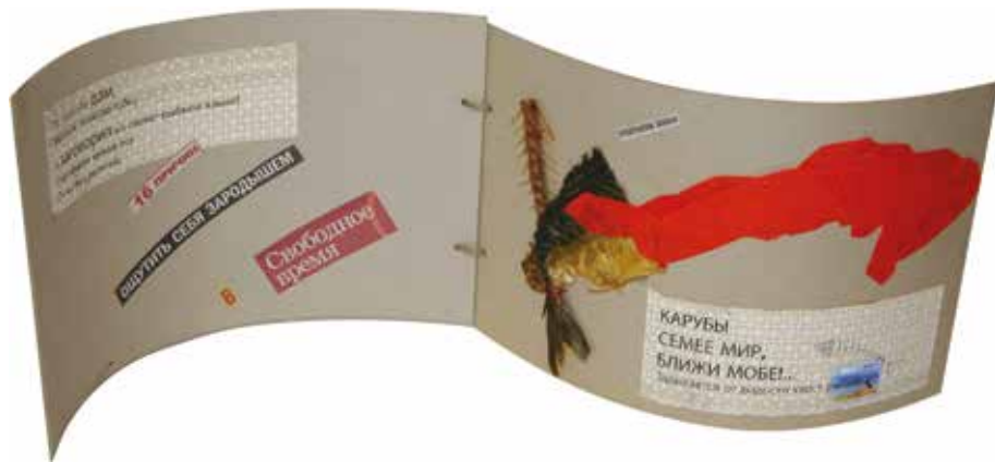
Михаил Погарский. Карубы. 2011

Картон, коллаж, ассамбляж, принтер, сургучные печати, штамп