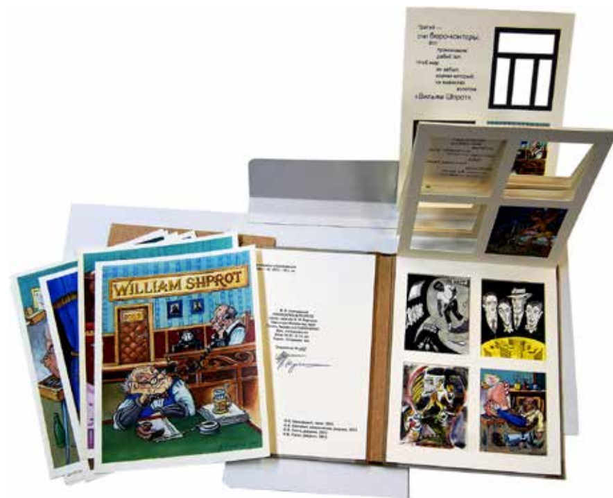
В.Гоппе, В.Лукин, В.Корчагин. «Владимир Маяковский. Небоскреб в разрезе» Литографская бумага, цифровая печать, обложка: ткань, переплётный картон, трафаретная печать. 2013

Александр Стоцкий. Кубофутуристическая клавиатура В. Маяковского. 2015