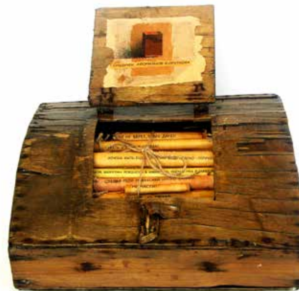
Сергей Смирнов. Сундучок афоризмов Козьмы Пруткова. 2012

Юнель Юран. Ветер есть дыхание природы. 2013