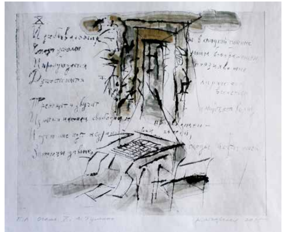
Вера Аткарская. Александр Пушкин, Солнце. 2014–15 Бумага, сухая ила, монотипия. Уникальный экземпляр