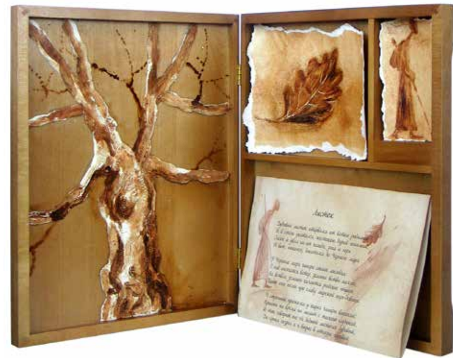
Гюнель Юран. М.Ю. Лермонтов. Листок. 2014 Белила, деревянный бокс, выжигание, бумага, акварель, печать

Гюнель Юран. М.Ю. Лермонтов. Листок. 2015