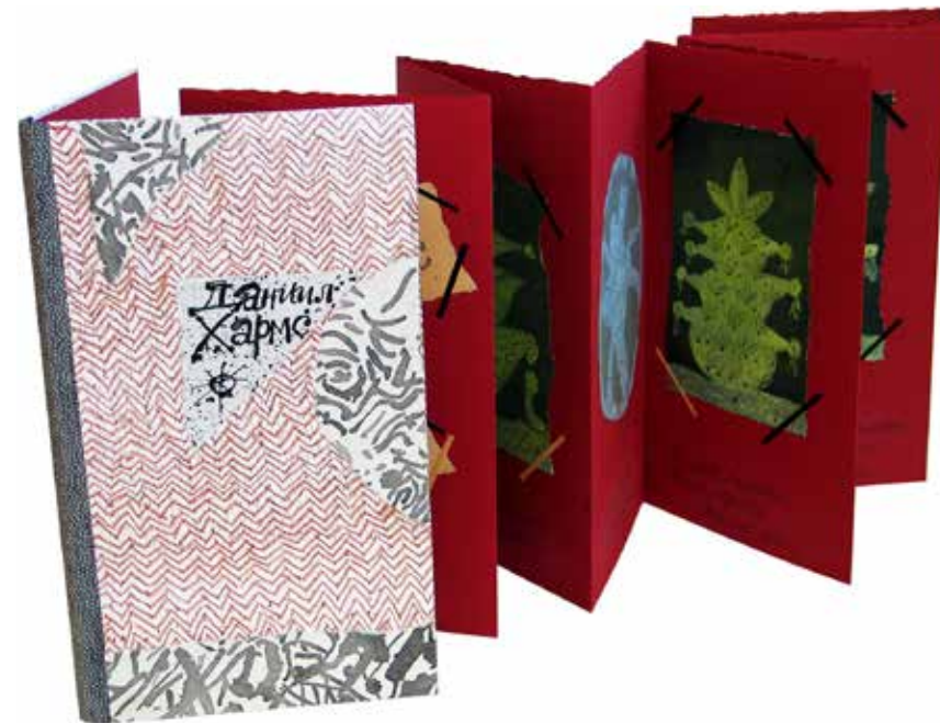
Власов Василий. Д. Хармс. Скупость. 2015 Бумага, картон, монотипия, каллиграфия