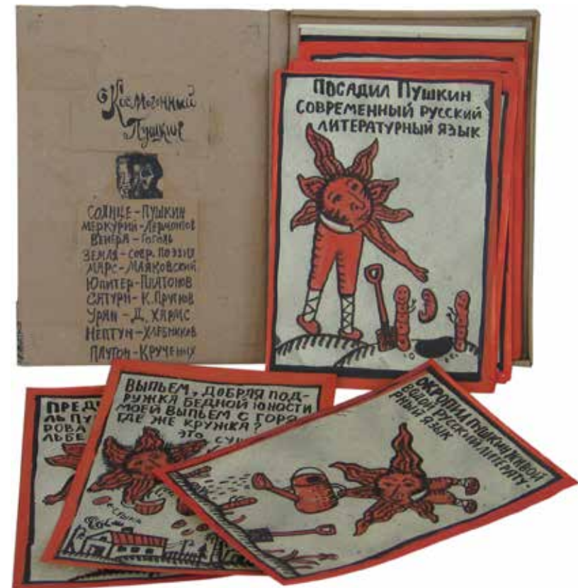
Николай Крацин. «Пушкин. Репка». 2015